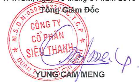
YUNG CAM MENG